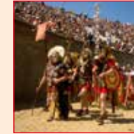
Archäologischer Park in Xanten