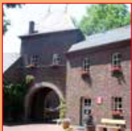
Wasserschloss in Issum mit dem Museum „His-Törchen“